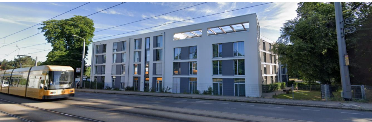
Neubau eines Pflegeheimes – Dresden / Sachsen.