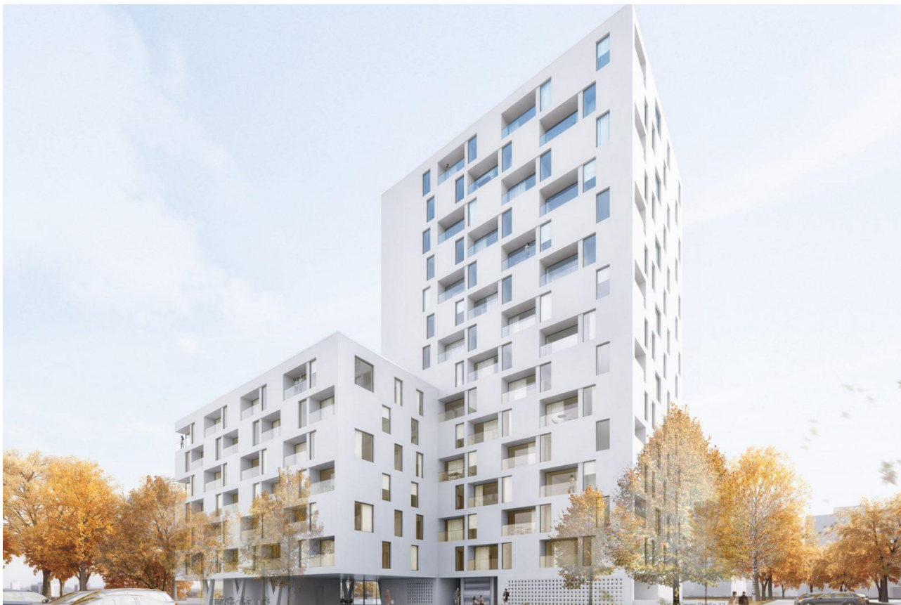
Mehrfamilienhaus mit Tiefgarage – Dresden / Sachsen.