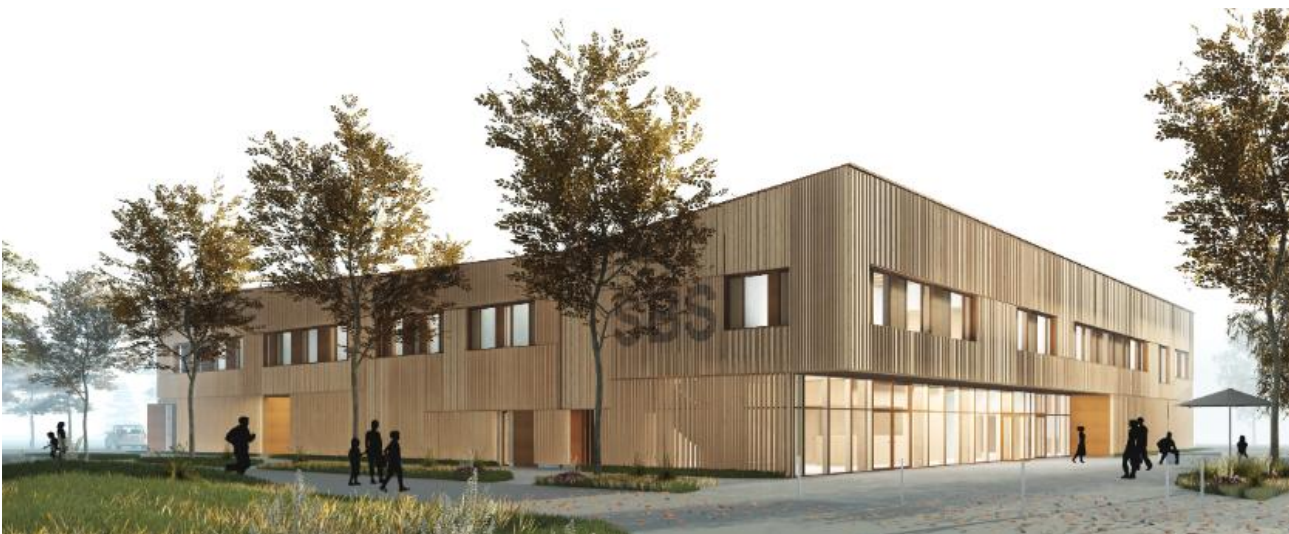
Neubau Verwaltungszentrale Sachsenforst Graupa – Pirna / Sachsen (Quelle: https://partnerundpartner.com/de/projects/verwaltungsbau-in-holz ).