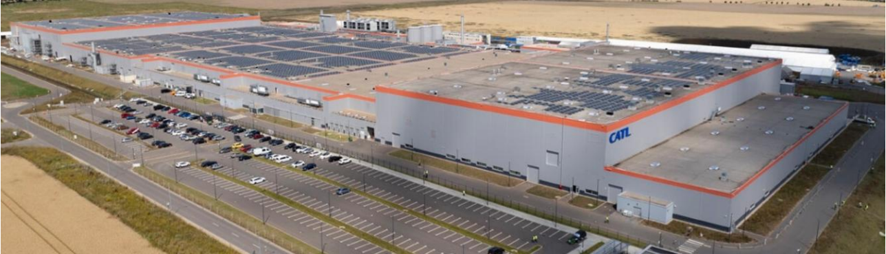
Neubau einer Großfabrik für Kfz-Batterien – Erfurter Kreuz / Thüringen.