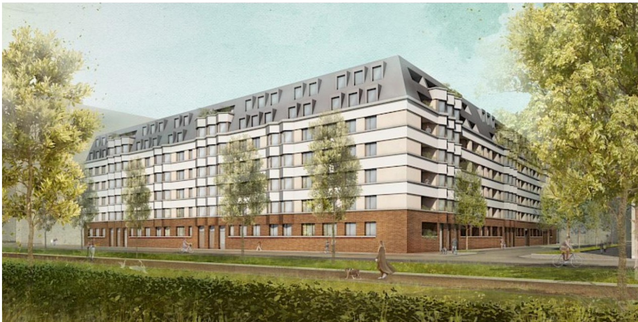
Neubau Wohnungsbau für 152 Mietwohnungen mit Tiefgarage – Dresden / Sachsen.