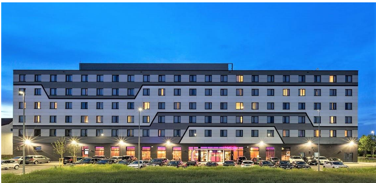
Hotel mit 188 Zimmern – Kelsterbach / Hessen (Quelle: https://www.tenbrinke.com/de/projekte/abgeschlossene-projekte/referenzen-details/moxy-hotel-ie6977.html ).