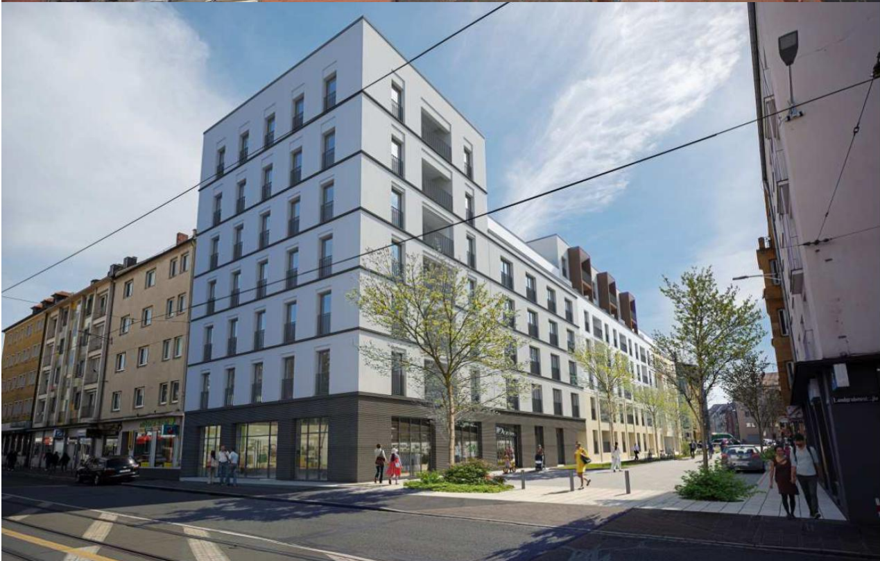
Neubau einer Wohnanlage mit Gewerbe im EG und Tiefgarage – Nürnberg / Bayern (Quelle: Foto Studio DA - Daniel Neumann M.A. Architekt).