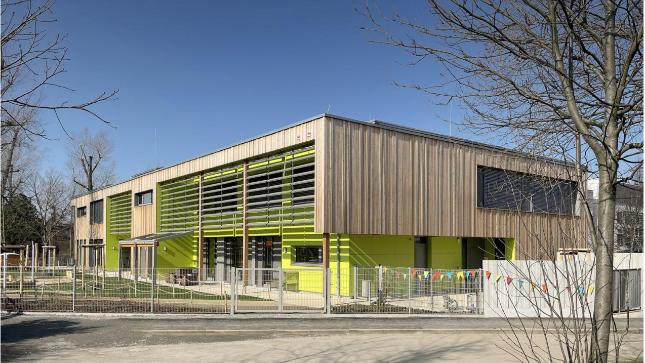
Neubau Kindergarten / Kita – Dresden / Sachsen.