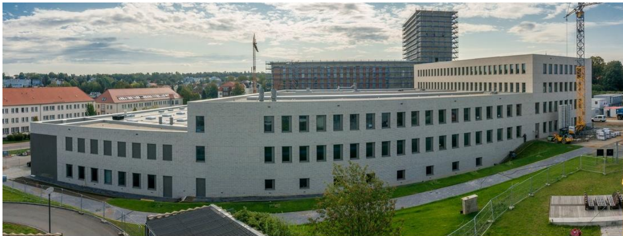
Neubau des Zentrum für effiziente Hochtemperatur-Stoffumwandlung für die TU-Bergakademie Freiberg – Freiberg / Sachsen