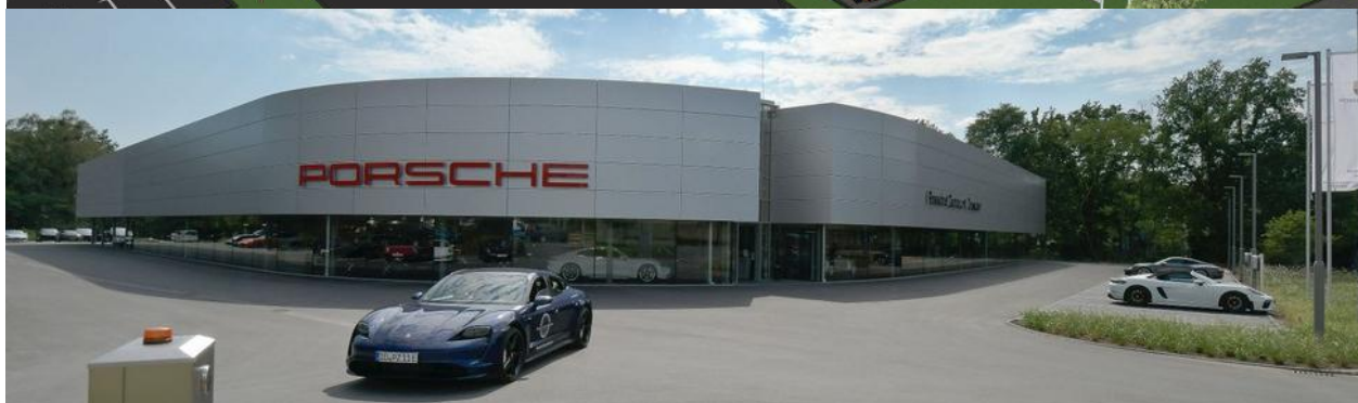
Neubau Porsche Zentrum Dresden – Dresden / Sachsen (Quelle: https://www.gia-mbh.de/home.html#ui-id-11_ ).