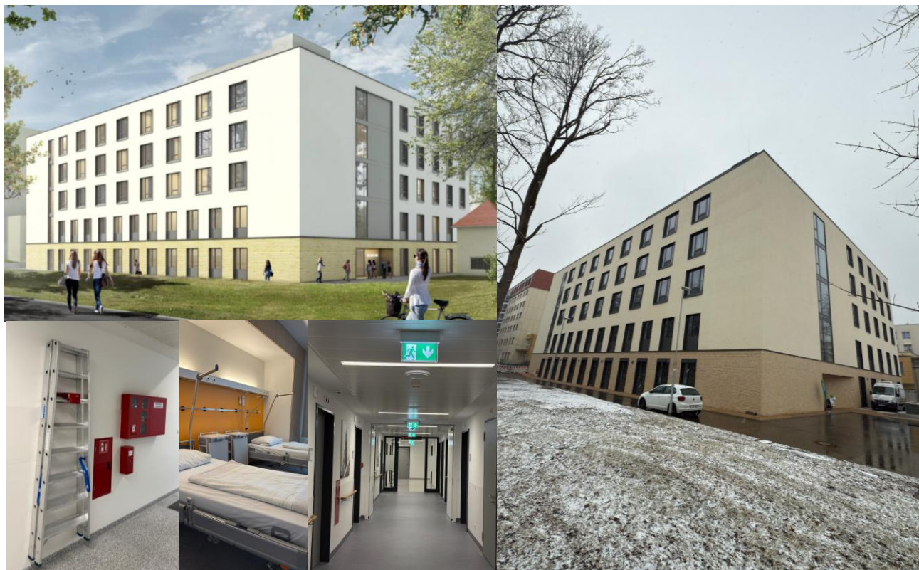
Neubau Innere Medizin und Geriatrie des Heinrich-Braun-Klinikum Zwickau – Zwickau / Sachsen (Quelle: https://www.sweco-gmbh.de/showroom/heinrich-braun-klinikum-zwickau/ ).