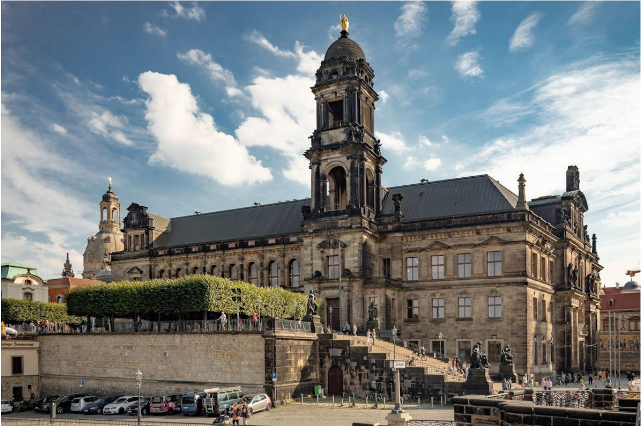
Sitz des Oberlandesgerichts Dresden sowie des Landesamtes Denkmalpflege – Dresden / Sachsen.