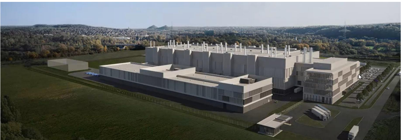
Neubau Siliziumkarbid-Halbleiter-Fabrik – Ensdorf / Saarland.