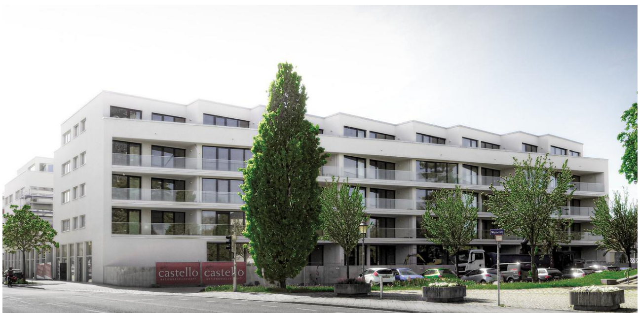
Neubau einer Wohnanlage mit Gewerbe im EG – Dresden / Sachsen.