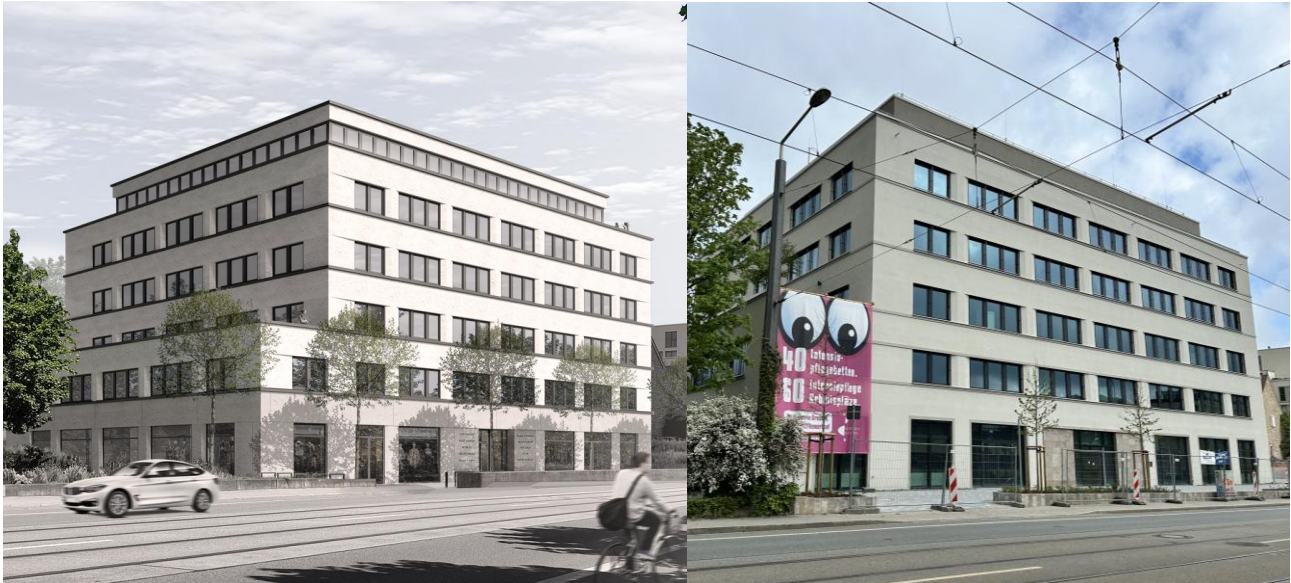
Mehrzweckgebäude (u.a. für intensiv außerklinischer Betreuung) mit Tiefgarage – Dresden / Sachsen.