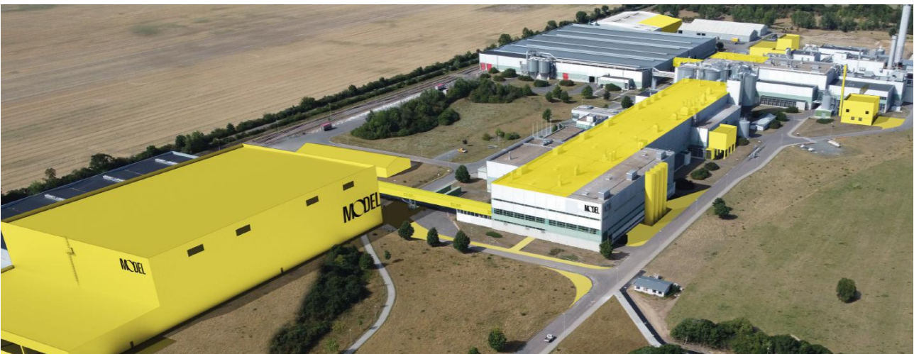
Neubau eines Rollenhochlager sowie Um- und Anbauten im Bestand – Eilenburg / Sachsen (Quelle: https://www.modelgroup.com/de/de/ueber-uns/standorte.html#accordion-960ace76f5-item-45795918ef ).