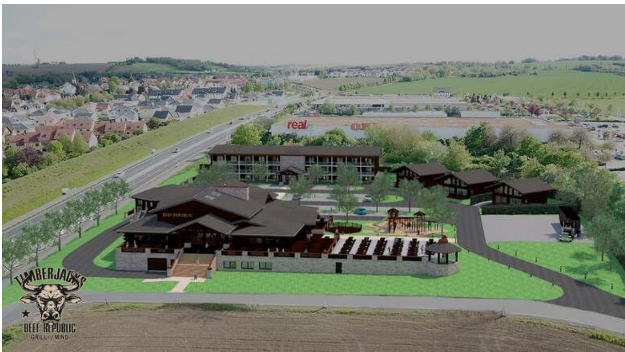
Neubau Westernrestaurant, eines Motels und Chalets – Bannewitz / Sachsen.