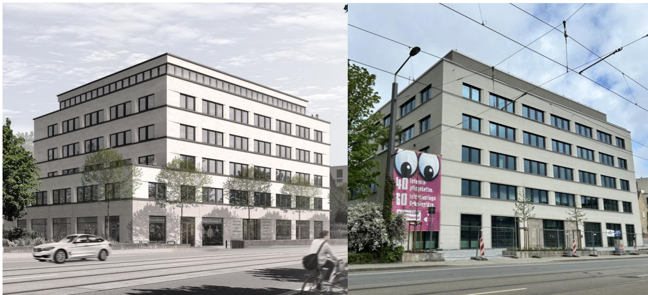
Mehrzweckgebäude (u.a. für intensiv außerklinischer Betreuung) mit Tiefgarage – Dresden / Sachsen (Quelle: https://www.kadur-gruppe.de/gesundheitszentrum-dresden-mitte/ ).