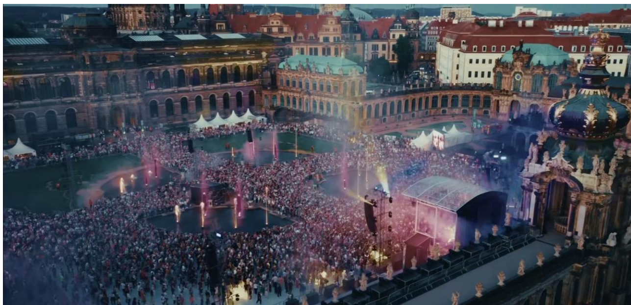
Versammlungsstätten im Freien – Dresden Zwinger / Sachsen